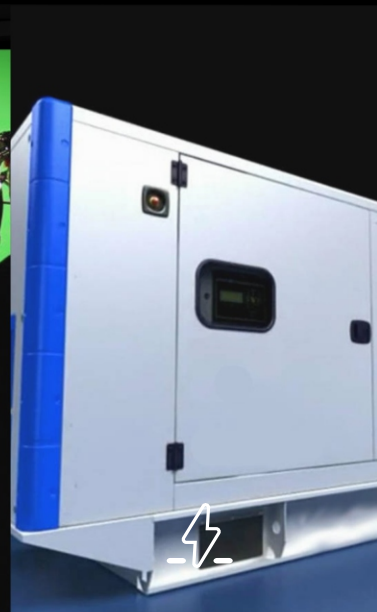
Geradores em Paralelo