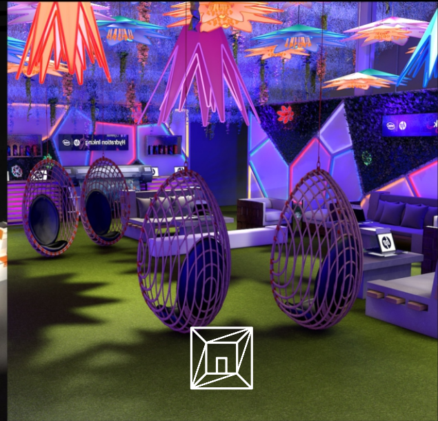
Ambientação de Espaços