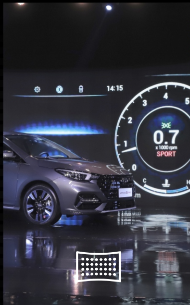
Painéis de LED HD

Estúdio profissional completo para suas lives e gravações.