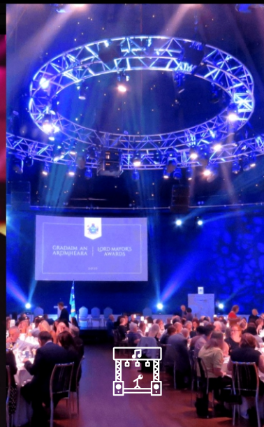
Estruturas e Palcos