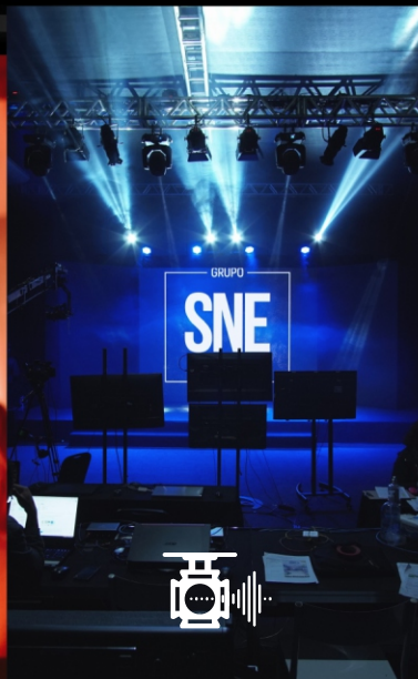
Som e Luz Profissionais