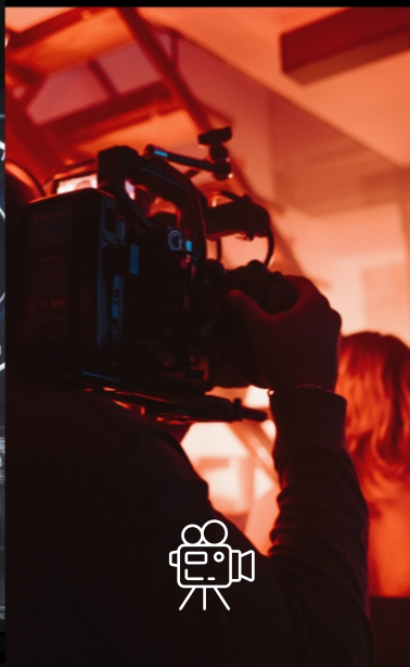
Captação Full HD