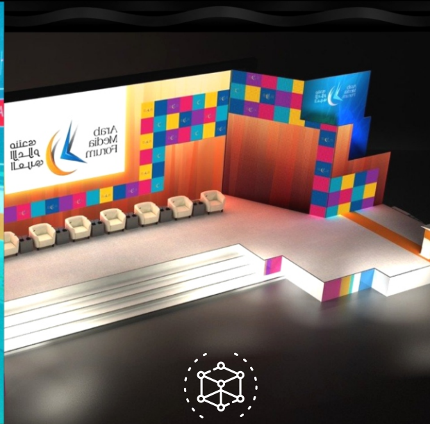
Maquetes Projetos 3D