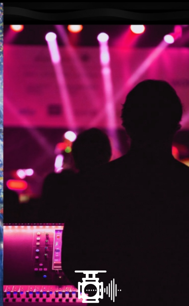
Som e Luz Profissionais