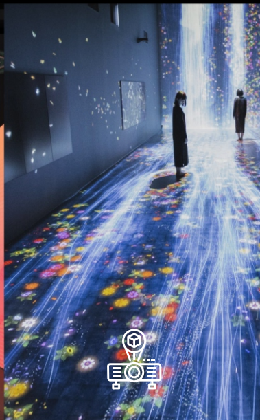
Projeção e Mapping