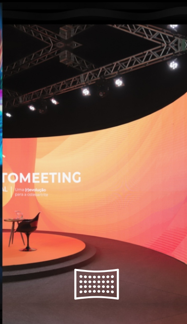
Painéis de LED HD